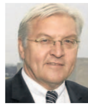
Frank-Walter Steinmeier hat sich im Truderinger Festzelt angekündigt.

„Es ist eine besondere Ehre, dass uns der Außenminister trotz seines dicht gestaffelten Terminkalenders die Ehre erweist“, freut sich Markus Rinderspacher (MdL). Wie die SPD gestern mitteilte, kommt Vizekanzler und Bundesaußenminister Frank-Walter Steinmeier auf Einladung des SPD-Landtagsabgeordneten nach Trudering. Steinmeier wird am Sonntagvormittag, 24. Mai, bei der traditionellen Festzeltveranstaltung der Sozialdemokraten die Festrede halten. Zwei Wochen vor der