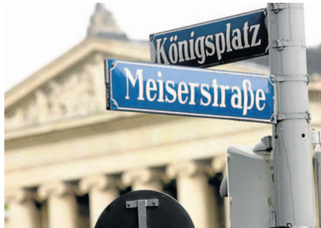
Das Streitobjekt: Die Umbenennung der Meiserstraße ist beschlossen, aber noch nicht vollzogen.

in Folge des missglückten Attentats hingerichtet wurden, lautete das Urteil für Gerstenmaier sieben Jahre Zuchthaus. 1949 wurde Gerstenmaier Bundestagsabgeordneter der CDU. Von 1954 bis 1969 war er Bundestagspräsident.